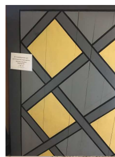
Golv målat med linoljefärg