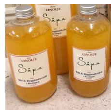
Linoljesåpa till såpskurade golv